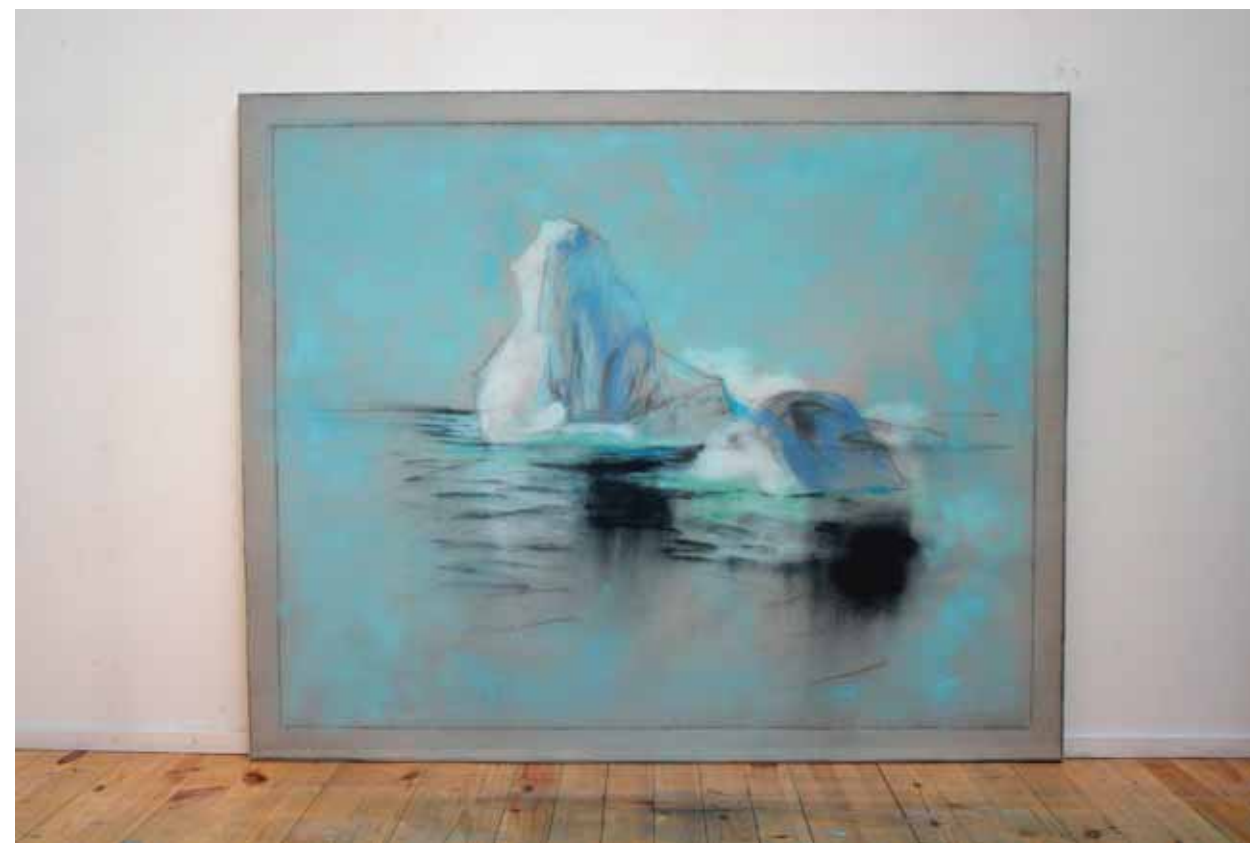
Saari 2006 130 x 160 kvartsihiekkä, pigmentti, akryyli kankaalle