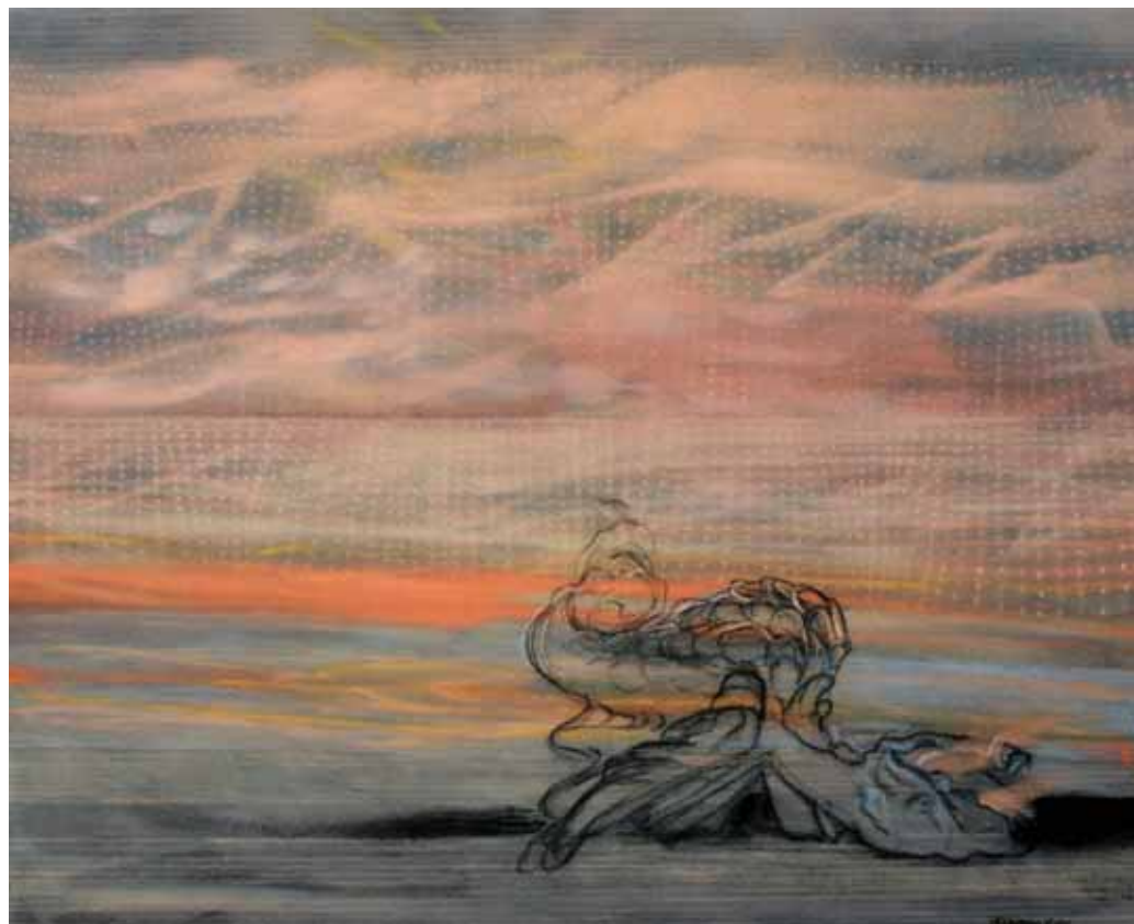
Lennon loppu 2005 130 x 160 kvartsihiekkä, hiili, pigmentti, akryyli kankaalle