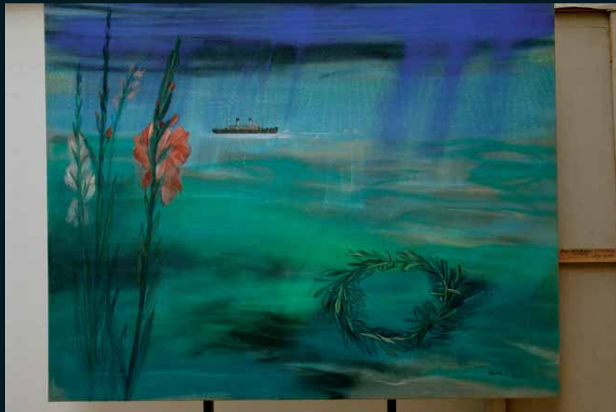
Tarmo 2005 130 x 160 kvartsihiekkä, pigmentti, akryyli kankaalle