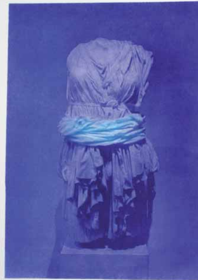
Roomalainen mekko 2000 34 x 23 polymeerigravyyri