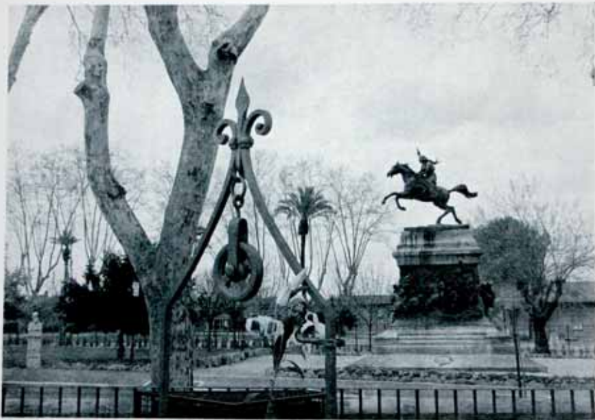
Anita 2000 20 x 24 polymeerigravyyri

Opin tuntemaan Roomaa ensi kerran tullessani opiskelemaan tänne 1967 Helsingistä, Suomen taideakatemian koulusta. Accademia di Belle Arti oli fyysinen tukikohtani, sen ympärille rakentui työskentelyn ja olemisen runko.