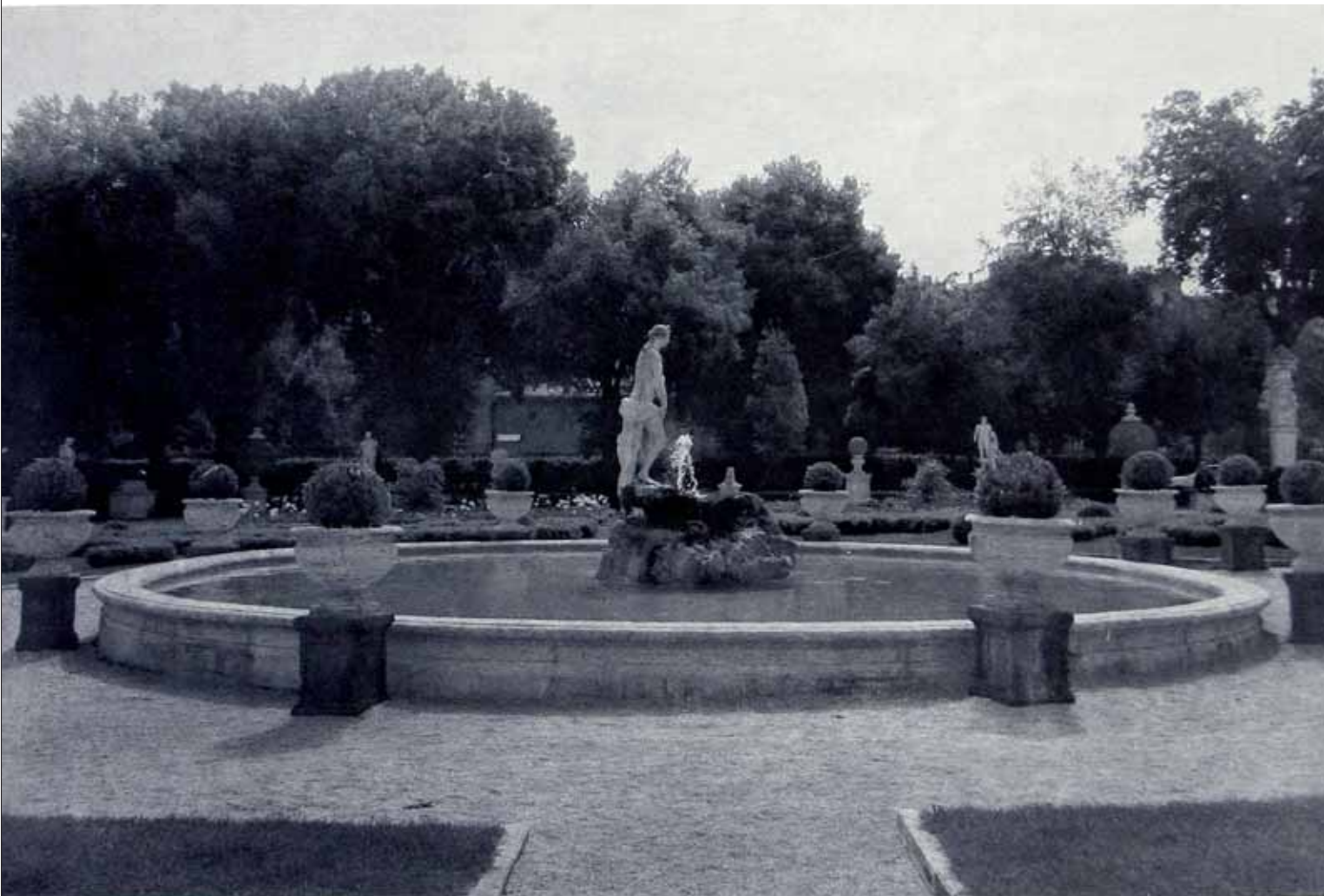
Villa Borghese 2000 23 x 34 polymeerigravyyri