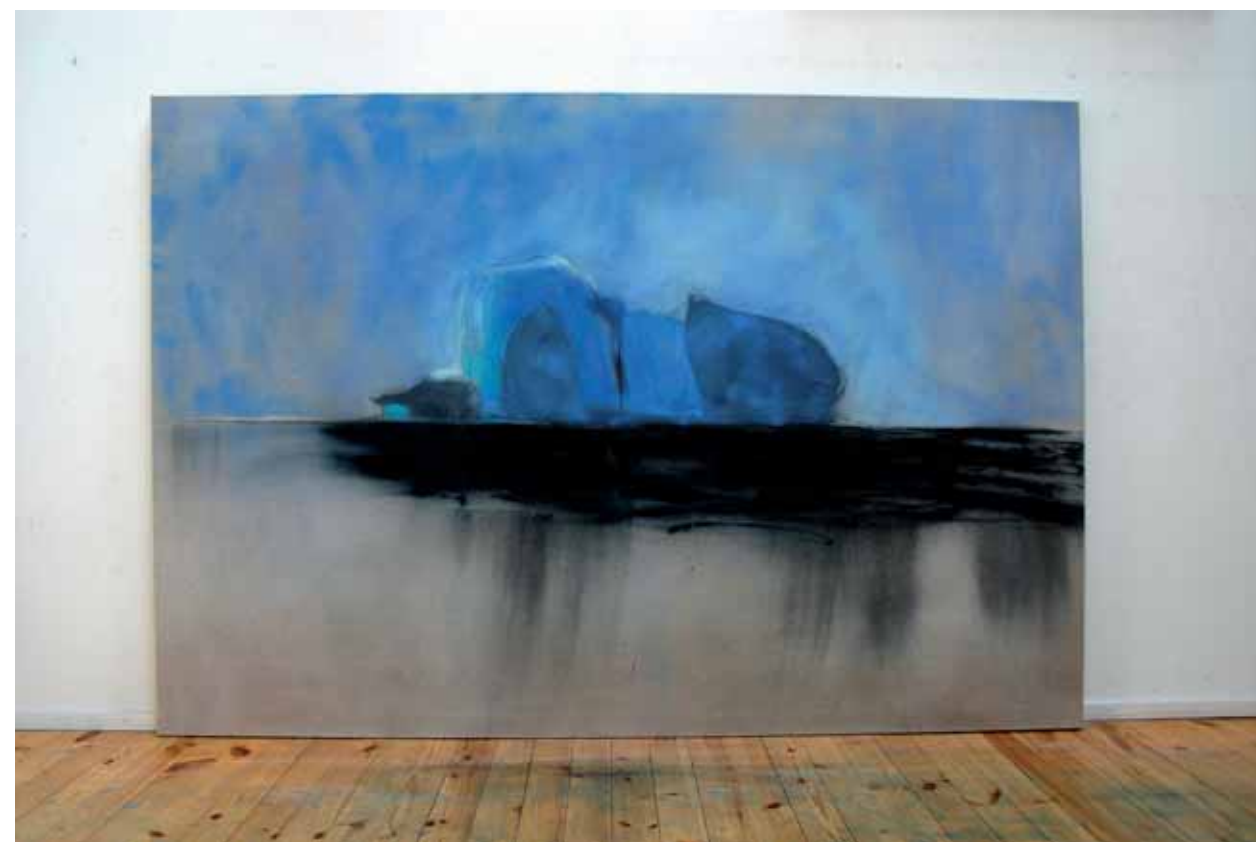
Suuri kolossi purjehtii 2006 150 x 220 kvartsihiekkä, hiili, pigmentti, akryyli kankaalle