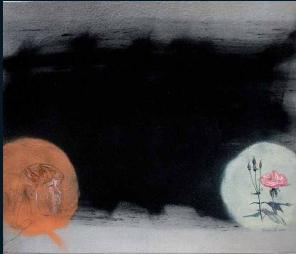
Ruusu 2006 85 x 100 kvartsihiekkä, hiili, pigmentti, akryyli, oljyväri kankaalle