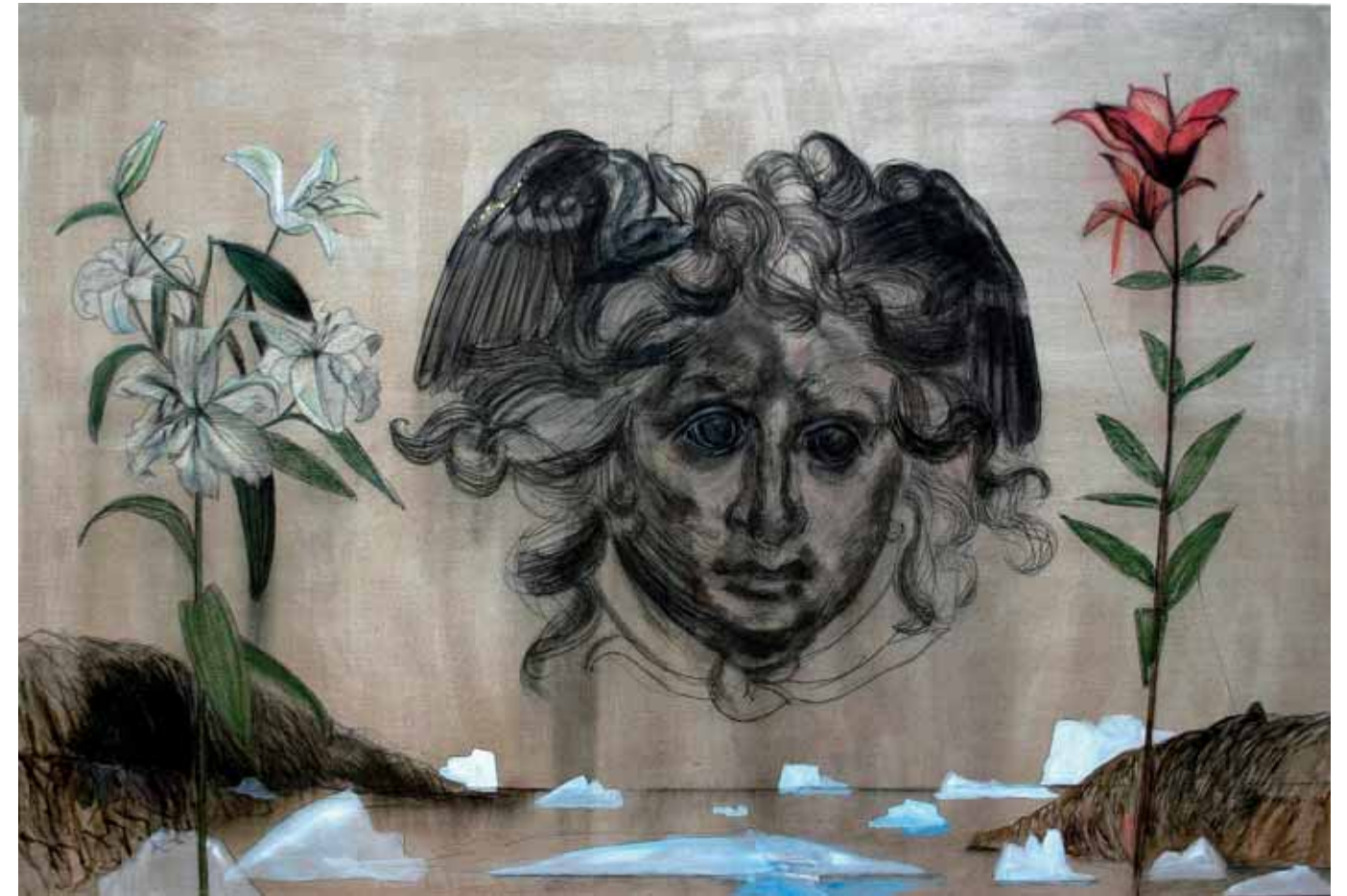
Medusa katsoo yli Julianehäbin lahden 2002 150 x 220 hiili, väripigmentti, akryyli kankaalle