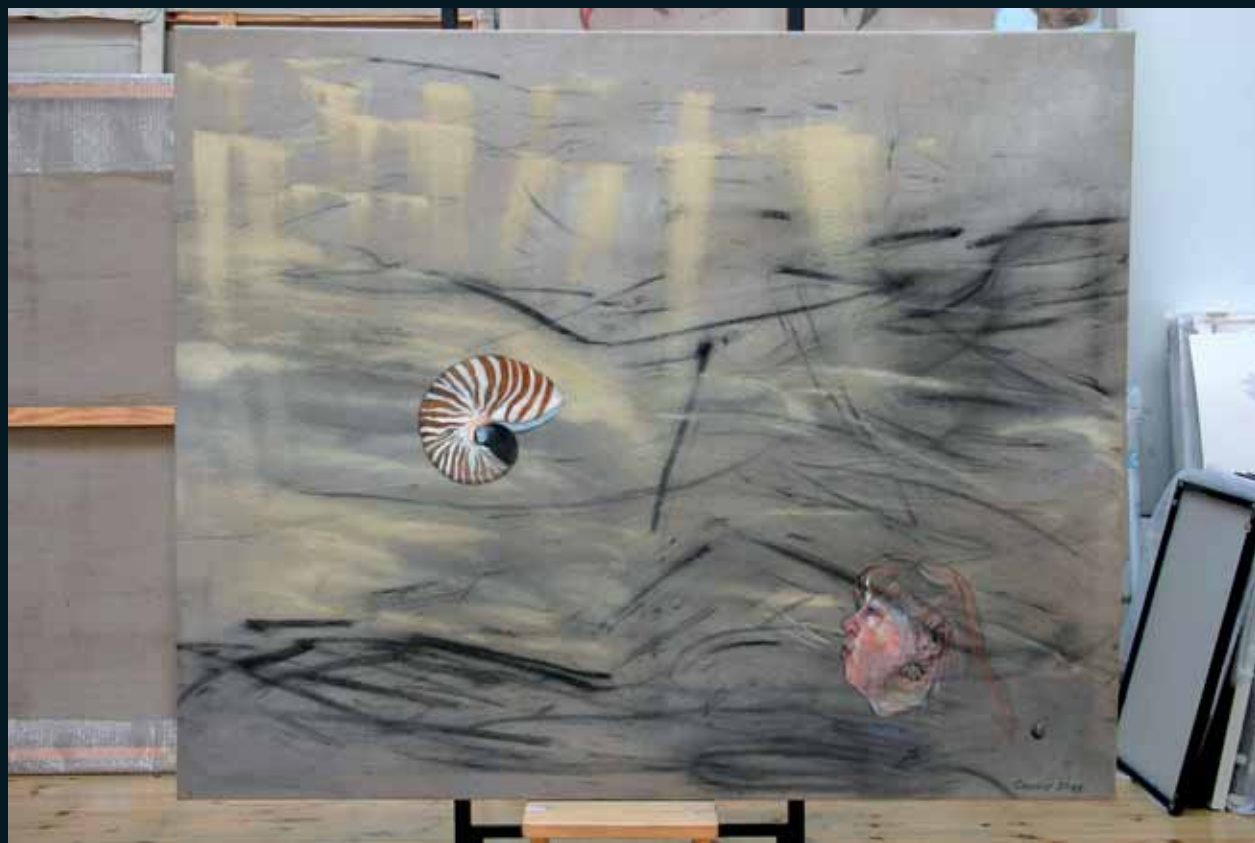
Puhaltaa kaakosta 2005 130 x 160 kvartsihiekkä, hiili, tuhka, pigmentti, akryyli kankaalle