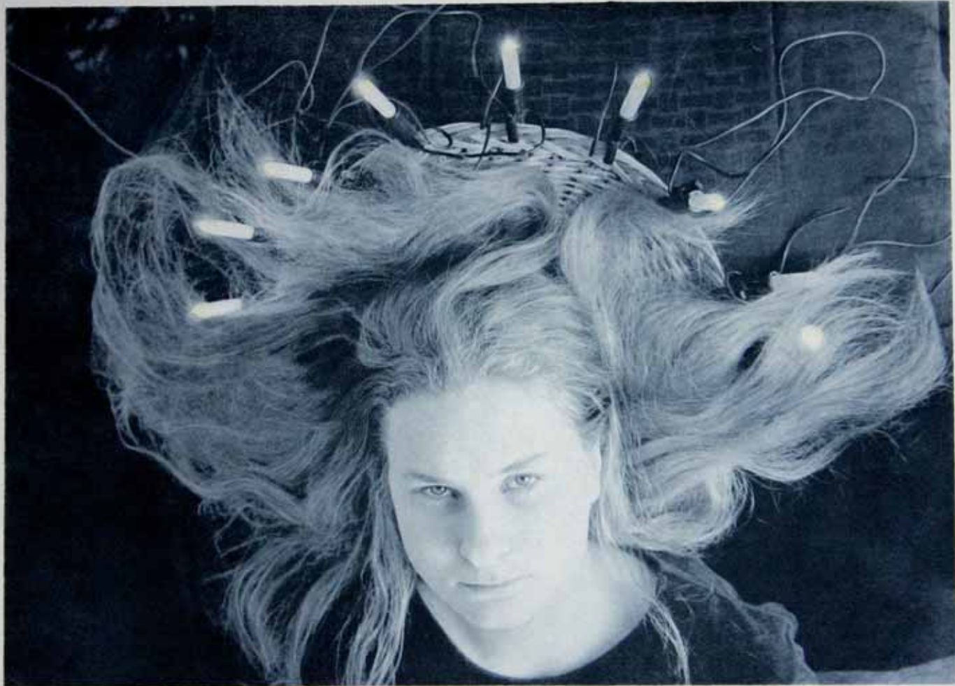
Maria/Medusa 2005 25 x 32 polymeerigravyyri