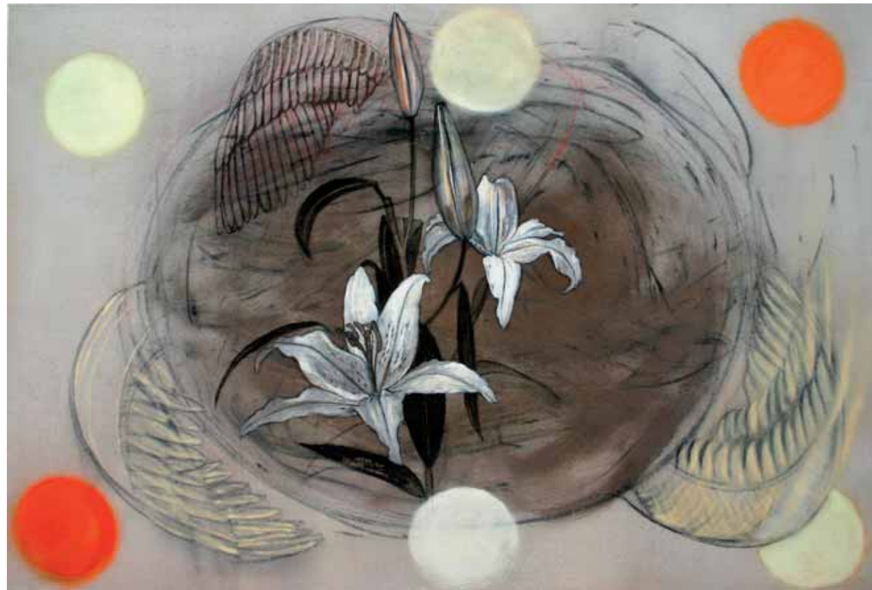
Liljat 2006 150 x 220 kvartsihiekkä, hiili, tuhka, pigmentti, akryyli kankaalle